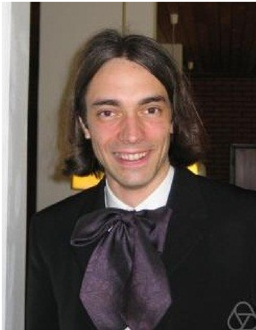
Cédric Villani, médaille Fields 2010