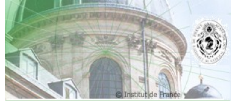
Table ronde APMEP « Vers le prochain centenaire »

Paris, Collège de France 22 novembre 2010