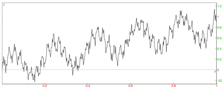
FIGURE 5.1 – La fonction f_{2,5} = \sum_{n=1}^{\infty} \frac{1}{n^2} \sin(n^5 \cdot) est continue mais très irrégulière.

correspond bien à une fonction continue car la série est normalement convergente. Pour \beta = 1 , on retrouve des séries de type Fourier. La série définissant f_{\alpha,\beta} converge toujours pour la norme uniforme, mais les dérivées des termes sont du type n^{\beta-\alpha} \cos(n^\beta x) ce qui peut donner une série explosant rapidement si \beta est grand. C'est avec ce type d'idée que Karl Weierstrass et Leopold Kronecker ont découvert en 1872 la première fonction continue partout mais dérivable nul part.