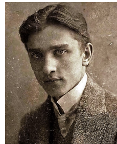
Stefan Banach 1892-1945 Pologne

Les deux définitions d'espace complet et d'espace de Banach seront équivalentes pour nous. En fait, il y a une distinction : un espace topologique dont toutes les suites de Cauchy convergent est dit complet. Quand cet espace est de plus un espace vectoriel normé, alors on parle d'espace de Banach. Comme ce cours ne regarde que ce cas particulier d'espace topologique, les deux définitions se recouvrent. Le nom de Banach revient souvent en analyse fonctionnelle.